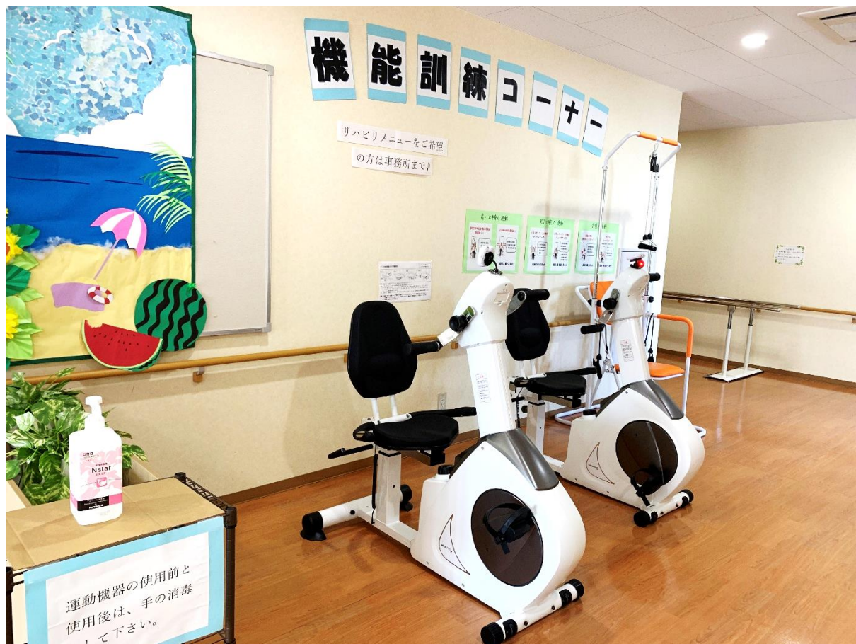
・ 3. 5m平行棒

サービス付高齢者向け住宅翠のさとでは、ご入居者の皆様が元気で充実した生活が送れるように、機能訓練の機器を導入いたしました。ご入居者のお好きな時間にご利用ができます。またスタッフの目が届きやすい玄関ホールに設置してありますので安心・安全にご利用いただけます。